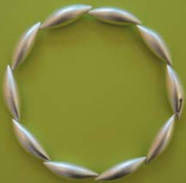
Collier von Erich Zimmermann, Augsburg

Öffnungszeiten: Mo bis Fr, 10 - 18 Uhr Sa und So, 11 - 17 Uhr