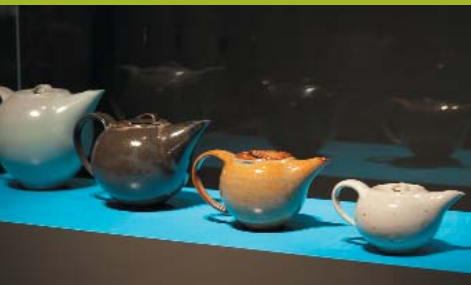
Fotos: Daniel Stoller, Trier: 3 Hängeleuchten, Basalt Helena Schepens, Antwerpen (B): 3 Gefäße, Holz / Wandbild, Metall Keramische Werkstatt Margareten- höhe, Essen: Teekannen, Steinzeug, Françoise Joris, Tarcienne (B): Porzellanobjekt

Feinheit in der Ausführung und eine üppige Phantasie. Sie repräsentieren eine der vielen Möglichkeiten der zeitgenössischen keramischen Gestaltung mit einer höchst persönlichen Ausdrucksweise. Ohne jegliche profane Funktion sind sie einfach nur eindrucksvoll präsent.