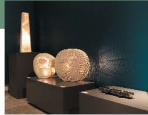
Keramische Leuchtoobjekte von Manfred Braun, Staatspreis Kunsthandwerk 2007, in der Ausstellung Westhandwerk

Die Wettbewerbe um den Staatspreis und Förderpreis für das Kunsthandwerk Rheinland-Pfalz 2010 sind inzwischen ausgeschrieben. Der Staatspreis ist mit 15.000 Euro und der Förderpreis mit 3.000 Euro dotiert. Im Rahmen der Wettbewerbe wird ferner der Preis des Handwerks Rheinland-Pfalz vergeben, der mit 5.000 Euro dotiert ist.