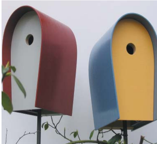
Vogelhaus, Peter Heidhoff, Bochumer Designpreis 2009